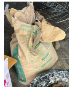
ปูนซีเมนต์