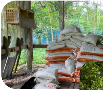
ปุ๋ยหมัก น้ำหมักชีวภาพ