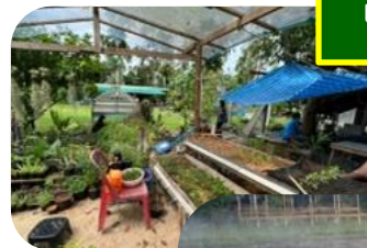
เพาะพันธุ์พืช