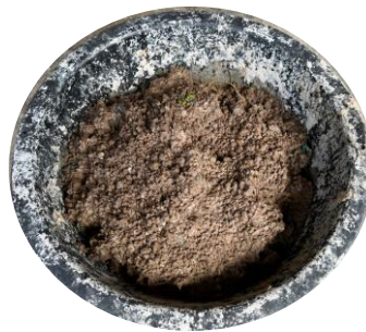
กระดาษลึงเปีย