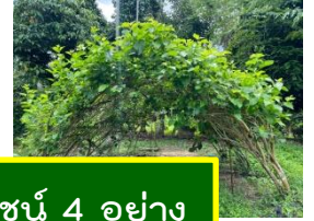
ป่า 3 อย่าง ประโยชน์ 4 อย่าง