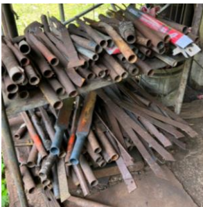
เหล็กแหนบ