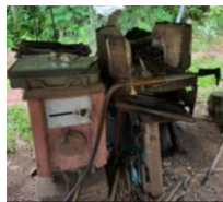
ตู้อเชื่อม