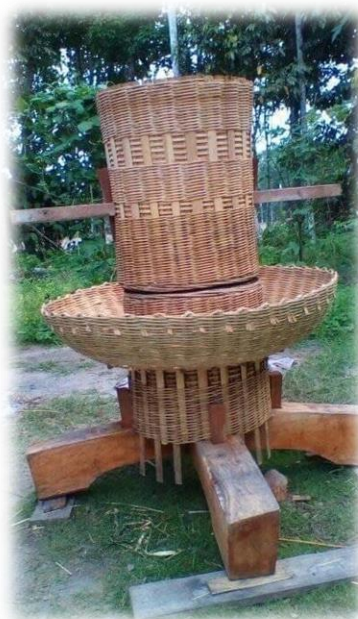
ครกสีข้าว